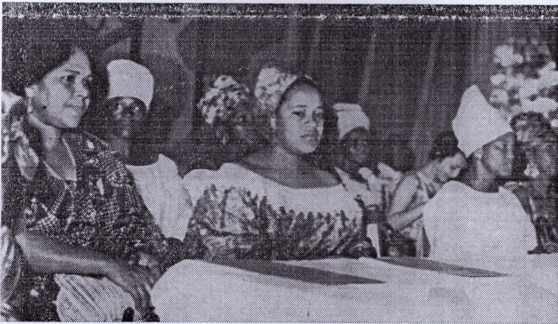
Sur notre photo : La tribune officielle. On remarque Mme Andrée Touré (au centre).